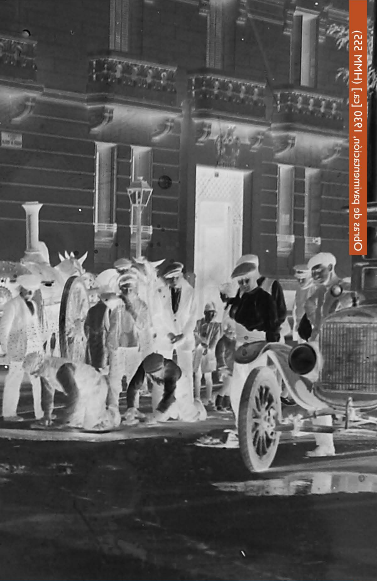
Opus de basimentorum. 1830 [ca.] (HMM 222)