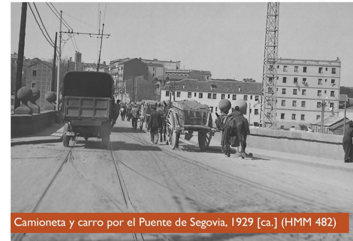
Camioneta y carro por el Puente de Segovia, 1929 [ca.] (HMM 482)

Pero el Ayuntamiento, en búsqueda de una imagen corporativa, también se representa a sí mismo como protagonista de estas transformaciones y nuevos servicios ofrecidos. Para ello se sirvió del hasta ahora desconocido Servicio Fotográfico